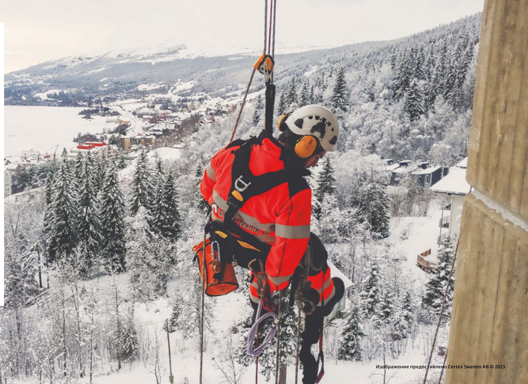
Схема сертификации специалистов IRATA широко признана в отрасли как стандарт для персонала, работающего с использованием канатного доступа, насчитывая более 100 000 квалифицированных активных техников по всему миру. IRATA аккредитована по стандарту ISO 17024 британским национальным органом аккредитации UKAS, что обеспечивает уверенность в том, что ее сертификационные услуги признаны в качестве международной лучшей практики.

IRATA International является ведущим мировым авторитетом в области промышленного альпинизма, и его методы установили международный стандарт для безопасной работы на высоте с момента создания ассоциации более 30 лет назад. С тех пор ассоциация лидирует в разработке и внедрении эффективных, безопасных и экологически ответственных решений в области высотных работ. Сегодня IRATA включает широкий спектр компаний-членов, работающих на мировом уровне, и широко представлена в таких промышленных секторах, как нефть и газ, строительство, возобновляемые источники энергии, геотехника и искусственная среда.